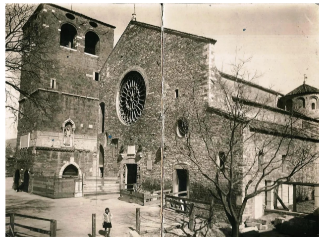
Trieste, Cattedrale di san Giusto