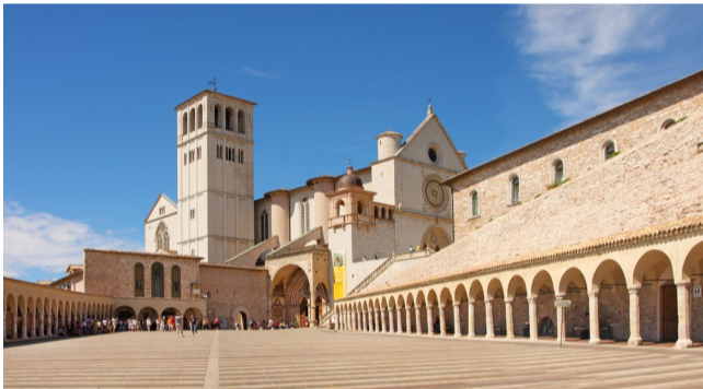
Assisi, Basilica di san Francesco